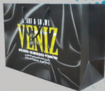
مدل آرنیکا ۲۱x۲۱x۳۰