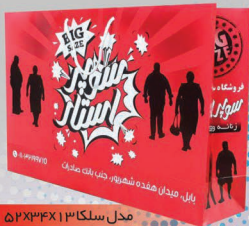
مدل سلکا ۱۳ ۵۲۸۳۴۸۹