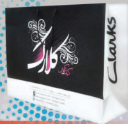
مدل ریولت ۲۱x۳۳x۴۶