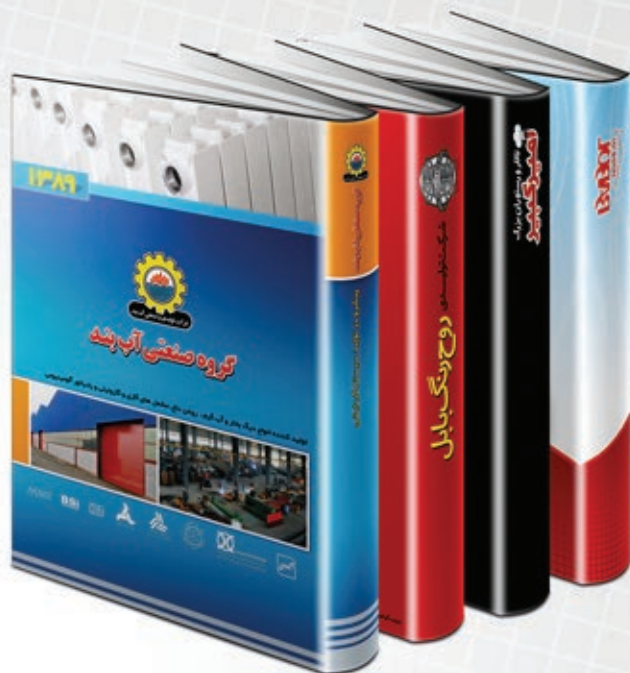
سر رسید با جلد اختصاصی