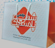
مدل استار ۱۳ ۳۳۳۲۵۰۱۳